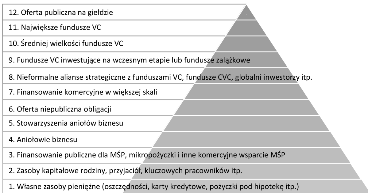
Rysunek 2. Piramida źródeł finansowania

A.J. Sherman (2005, s. 6–7) w swojej książce Raising capital wyróżnił 12 poziomów źródeł finansowania innowacyjnych przedsięwzięć (rysunek 2). W miarę przesuwania się w górę piramidy kryteria