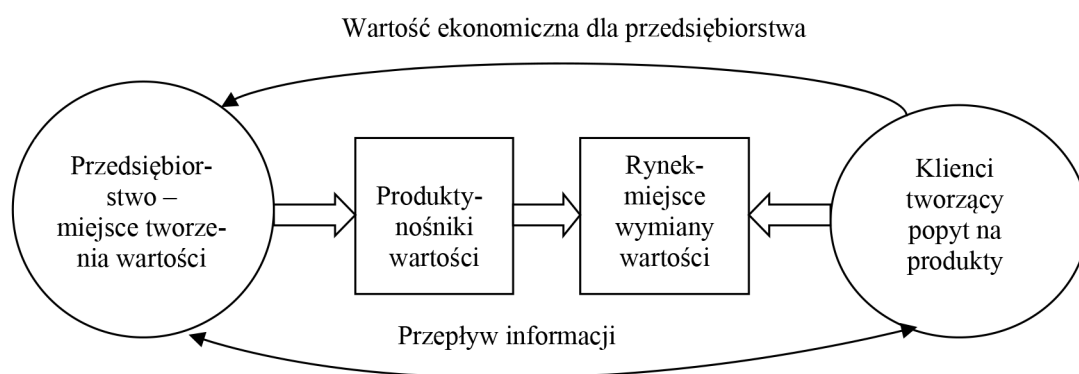
Rysunek 1. Tradycyjna koncepcja tworzenia wartości